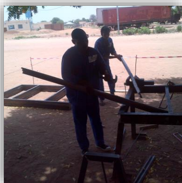
Paksoubo, apprenti soudeur