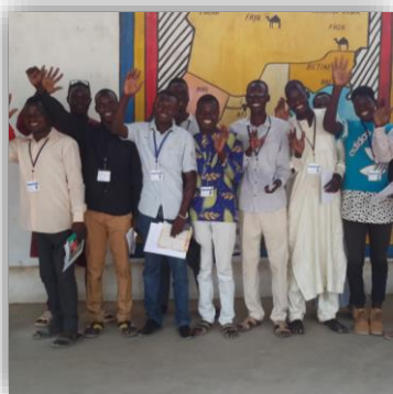
Les apprentis mécaniciens lors des cours théoriques

Akwada favorise l'innovation lorsqu'elle a un intérêt social pour la communauté.