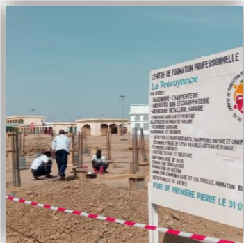
La construction avance, Associez-y votre nom !