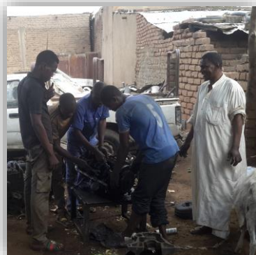
Travail autour du bloc moteur dans un garage accueillant des apprentis mécaniciens