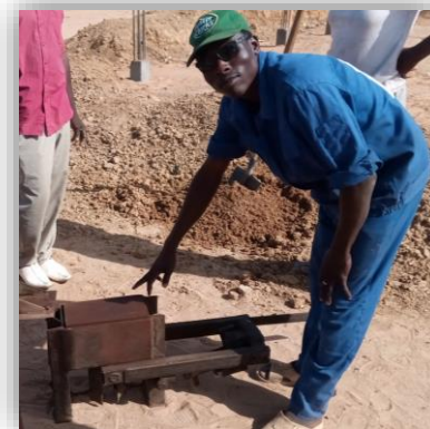
Premiers essais de briques en terre crue pressées